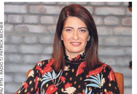
„Tagesschau“-Sprecherin Linda Zervakis hat ihre Stimme dem HVV geliehen