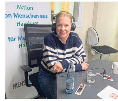
Mal nicht am Herd, sondern im Podcast-Studio: Spitzenköchin Cornelia Poletto